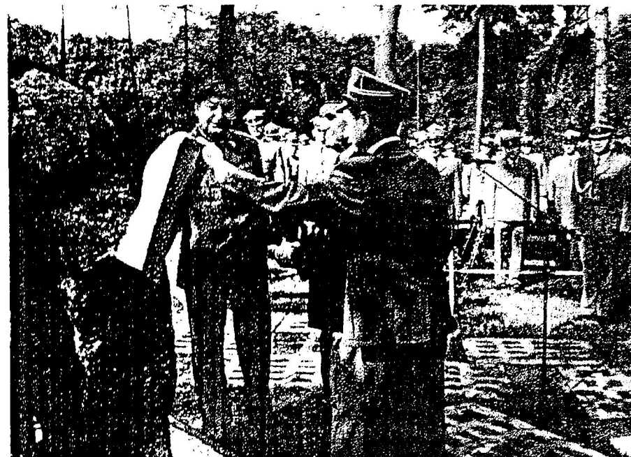
Moment odsłonięcia tablicy pamiątkowej