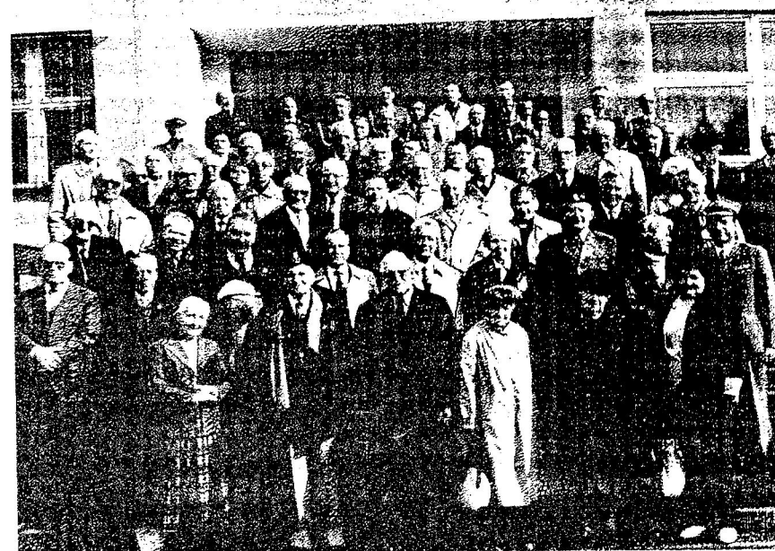
Uczestnicy Zjazdu przed blokiem dydaktycznym

o łącznościowcach, Kawalerach Orderu VM - o przekazanie nam tych danych. Pożądane byłyby następujące informacje : stopień wojskowy w chwili nadania i z ostatniego awansu, nazwisko i imię, w jakim oddziale lub kampanii zasłużył na odznaczenie, data nadania, przez kogo odznaczony i jeżeli to możliwe - numer orderu oraz legitymacji do niego. W następnym Komunikacie lub Biuletynie opublikujemy posiadany przez nas wykaz odznaczonych łącznościowców.