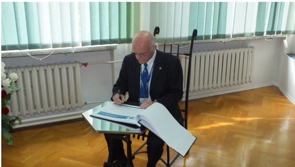
Pamiątkowy wpis do kroniki CSŁiI