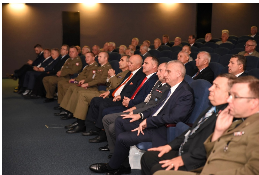
Goście obchodów Jubileuszu 25-lecia ŚZPŻŁ