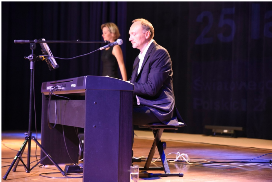
Koncert zespołu „b.dimention”

Oficjalną część obchodów zakończył koncert zespołu „b.dimention”.