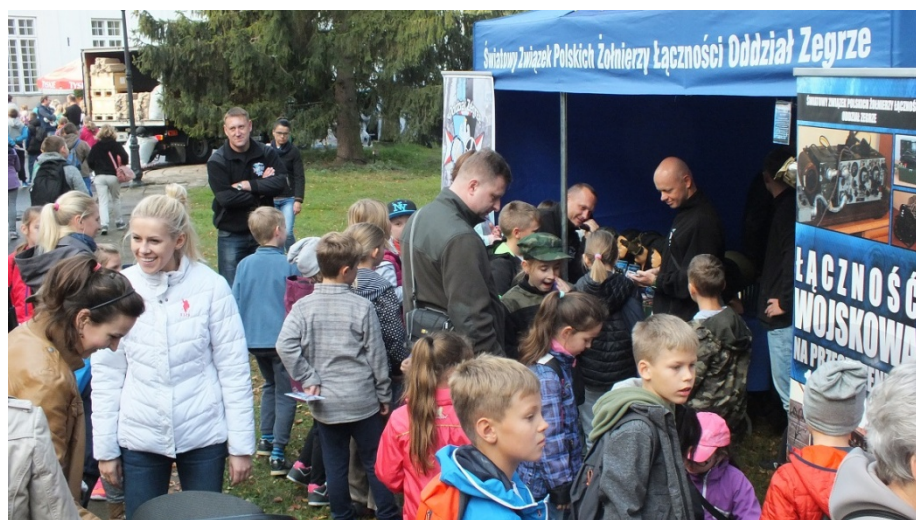
Festiwal Nauki - Jabłonna 2016r.

Wraz z powstaniem Oddziału „Zegrze” rozpoczęła się aktywna działalność w nowej dziedzinie czyli upowszechnianie wiedzy o Związku wśród społeczności lokalnej. Członkowie oddziału biorą aktywny udział w wydarzeniach lokalnych promując historię i tradycje wojskowej łączności.