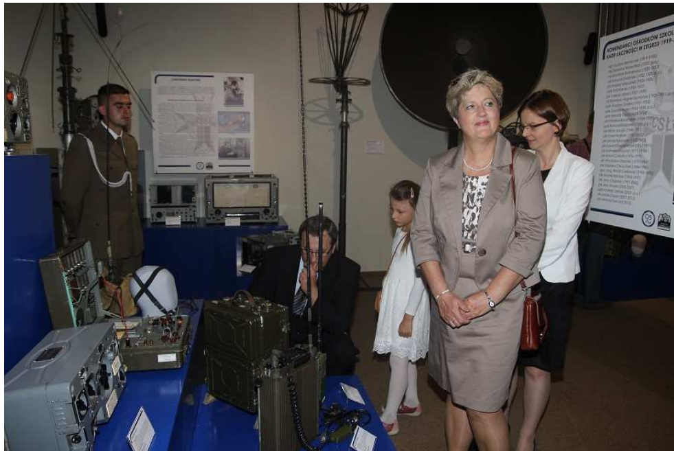
Muzeum Historyczne w Legionowie - wystawa czasowa 2014r.

Nie tylko historia przyświeca naszej działalności. Takim przykładem jest Oddział „Sieradz”, który jest współorganizatorem cyklicznych konferencji poświęconych najnowszym trendom w łączności wojskowej. Dotychczas zostało zorganizowanych osiem edycji konferencji pod tytułem "Ewolucja wojskowych systemów teleinformatycznych oraz Lessons Learned w świetle misji pokojowych i stabilizacyjnych".