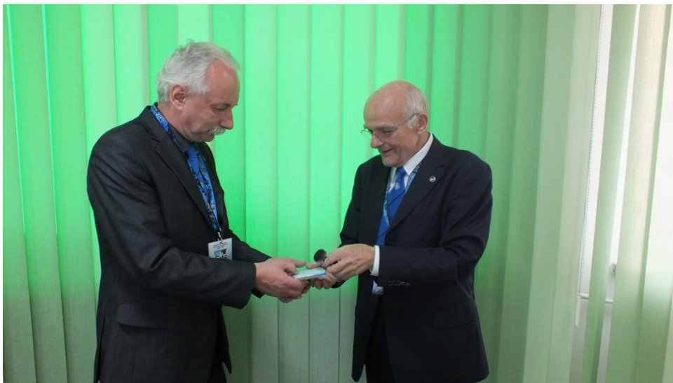
Przekazanie pieczęci związkowej