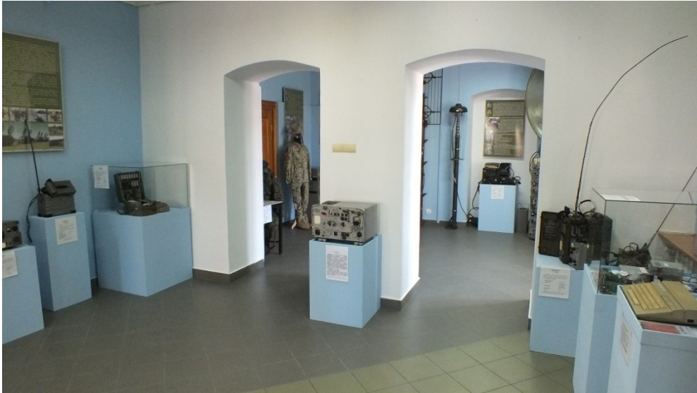
Muzeum Okręgowe w Sieradzu - wystawa stała