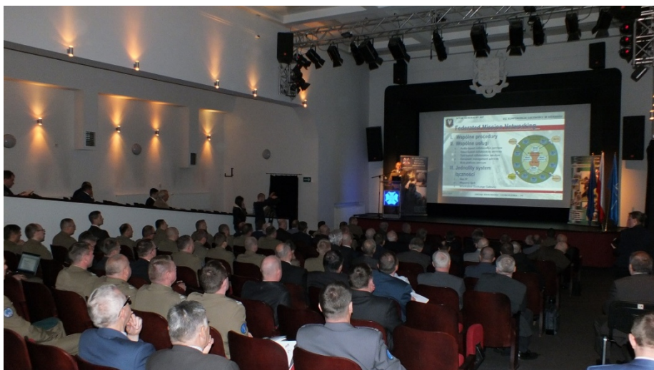
Konferencja w Sieradzu - 2016r.

Wraz z powstaniem Oddziału „Zegrze” rozpoczęła się aktywna działalność w nowej dziedzinie czyli upowszechnianie wiedzy o Związku wśród społeczności lokalnej. Członkowie oddziału biorą aktywny udział w wydarzeniach lokalnych promując historię i tradycje wojskowej łączności.