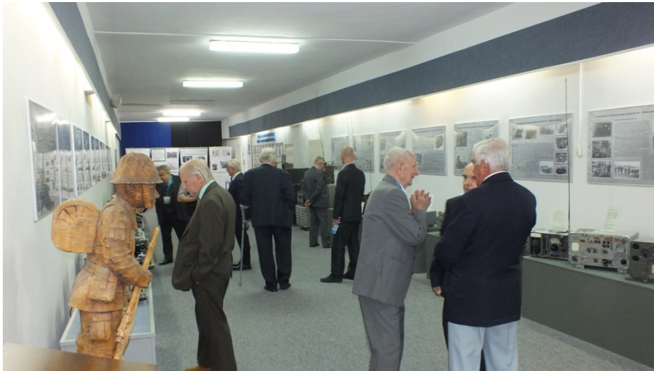
Zwiedzanie sali Tradycji CSŁiI