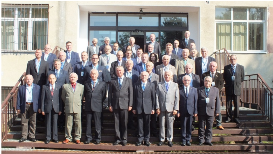
Delegaci na IX Walny Zjazd Delegatów ŚZPŻŁ

Celem Zjazdu było podsumowanie ostatniej trzyletniej kadencji oraz wypracowanie kierunków działań na lata 2018-2021. Dokonano również wyboru władz naczelnych Związku na IX kadencję.