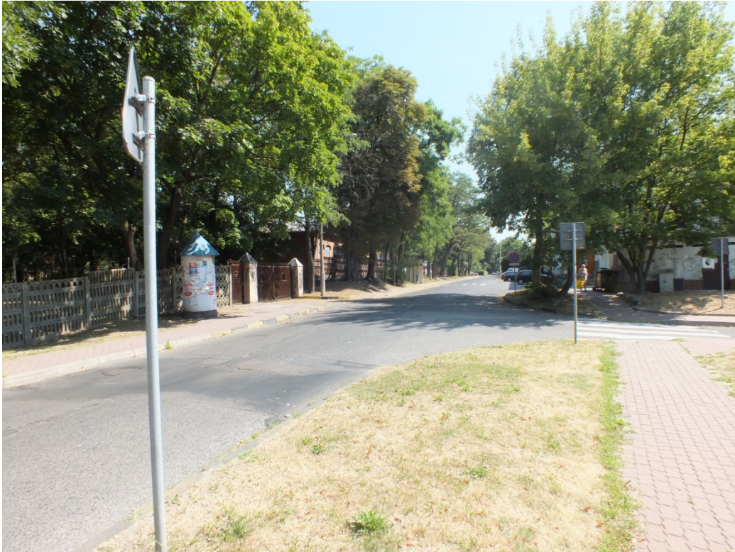
„Centralna” część ulicy Groszkowskiego