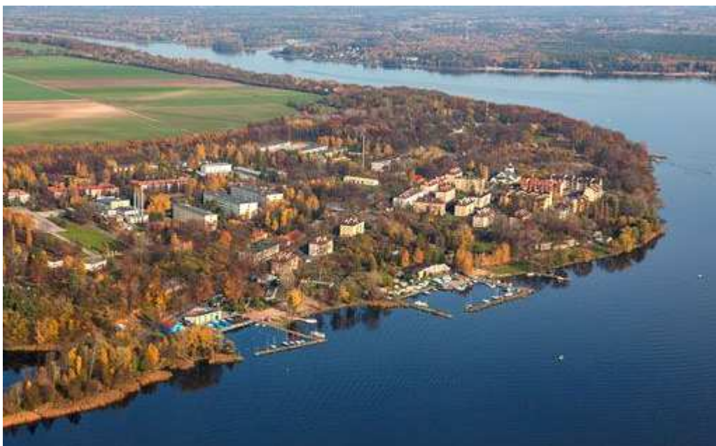
Zegrze z „lotu ptaka”

Łącznościowcom w mundurach jednoznacznie kojarzy się z ośrodkiem szkolenia kadr łączności. Różne były nazwy szkół, różne było ich przeznaczenie, ale od „zawsze” tzn. od roku 1919 szkołą się tutaj przyszli operatorzy wszelakiego sprzętu łączności używanego w Wojsku Polskim. Nie na darmo nazwano to miejsce „kolebką łącznościowców”. Obecnie w Zegrzu mieści się Centrum Szkolenia Łączności i Informatyki, które umiejscowienie jest przy ulicy Juzistek.