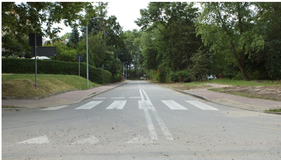
Ulica Pułku Radio (część znajdująca się poza koszarami)

Nazwa ulicy Pułku Radio dedykowana jest pułkowi radiotelegraficznemu z okresu II Rzeczypospolitej. Część ulicy ta przebiega przez teren CSŁiI oraz teren osiedla w kierunku WKS Zegrze.