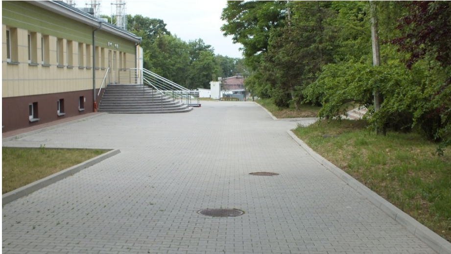
Ulica płk. Andrzeja Miączyńskiego