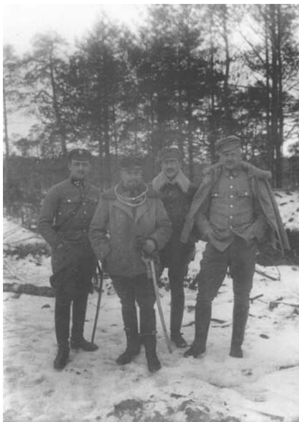
Rok 1916 - pierwszy z prawej

15 listopada 1918 roku powołany został na stanowisko szefa Oddziału II Łączności Sztabu Generalnego WP i równocześnie szefa Służby Łączności Wojska Polskiego. 10 grudnia tego roku wyznaczony został na stanowisko szefa Sekcji Elektrotechnicznej Departamentu III Technicznego (Techniczno-Inżynieryjnego) Ministerstwa Spraw Wojskowych. 15 marca 1919 stanął na czele Inspektoratu Wojsk Łączności podporządkowanego II wiceministrowi spraw wojskowych. 21 września 1919 roku awansował na podpułkownika. 1 marca 1920 mianowany został szefem Sekcji II Wojsk Łączności Departamentu II Wojsk Technicznych M.S. Wojskowych. W sierpniu następnego roku, po przejściu M.S. Wojskowych na organizację pokojową wyznaczony został na stanowisko szefa Wydziału Wojsk Łączności Departamentu VI Wojsk Technicznych. 3 maja 1922 roku został awansowany na stopień pułkownika.