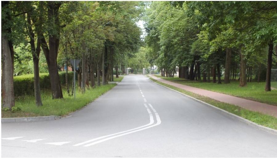
Ulica Pułku Radio (część znajdująca na terenie koszar)

kompanię radiotelegraficzną (1937) oraz na utworzeniu czwartej kompanii telegraficznej w 2. batalionie radiotelegraficznym (1939).