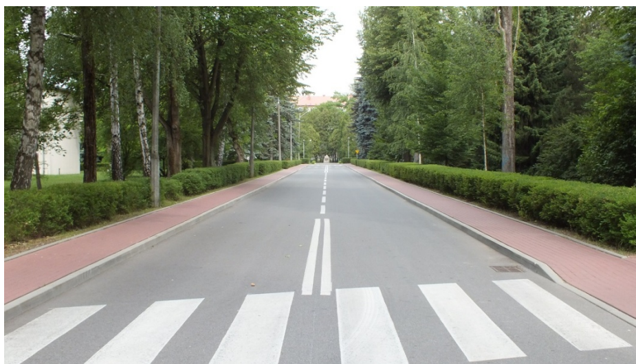
Ul. płk. Edwarda Gierasimczyka

Ulica płk. Edwarda Gierasimczyka znajduje się na terenie CSŁiI i biegnie od bloku szkolnego do budynku warsztatów łączności.