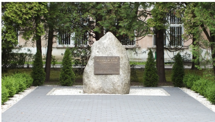
Kamień z tablicą pamiątkową poświęconą patronowi CSŁiI

Heliodor Cepa urodził się w Mieszkowie 29 listopada 1895 r. (Wielkopolska, zabór pruski, 5 km na północ od Jarocina). W latach 1902-1907 uczęszczał do szkoły powszechnej.