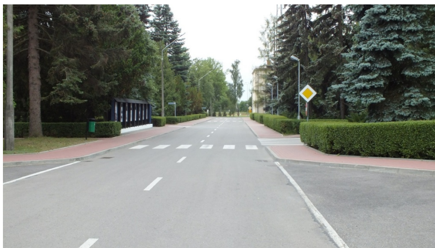
Ulica gen. bryg. Heliodora Cepy