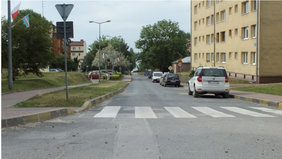
Ulica płk. Kazimierza Drewnowskiego