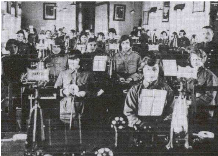
Juzistki podczas kursu w Centrum Wyszkożenia Łączności w Zegrzu

Nazwa ulicy jest bardzo znana, ale już zdecydowanie mniej ludzi wie skąd ona się wzięła. Juzistki to były kobiety, które w okresie międzywojennym w Zegrzyńskim Centrum Wyszkożenia Łączności były szkolone do obsługi aparatów telegraficznych Hughes'a zwanych popularnie juzem. Juzy polowe znajdowały się na wyposażeniu kompanii telegraficznych występujących na szczeblu Naczelnego Dowództwa, armii i dywizji. Aparaty znajdowały się również w placówkach pocztowych Ministerstwa Poczty i Telegrafów. W latach 1929-1934 odbyło się 7 kursów, na których przeszkolono 293 słuchaczki, które od nazwy aparatu określano mianem „Juzistek”.