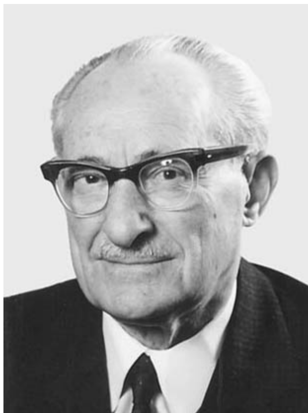
prof. Janusz Groszkowski

Od 1952 był członkiem rzeczywistym PAN; w latach 1955–1980 członek Prezydium, 1957–1962 wiceprezes, a w latach 1962–1971 prezes PAN. W latach 1923–1939 pracownik naukowo-dydaktyczny Politechniki Warszawskiej, w latach 1929–1939 dyrektor Instytutu Radiotechnicznego (od 1933 pod nazwą Państwowy Instytut Telekomunikacyjny) w Warszawie. W okresie sowieckiej okupacji Lwowa nadal prowadził działalność naukową. W latach 1940–1941 pracował w Instytucie Politechnicznym we Lwowie. Jako żołnierz AK w latach 1941–1944 był doradcą naukowo-technicznym ds. łączności Delegatury Rządu na Kraj. W latach 1945–1946 pracował w Politechnice Łódzkiej. W roku 1946 powrócił do pracy w Politechnice Warszawskiej (do 1968). W latach 1953–1963 był także związany z Instytutem Podstawowych Problemów Techniki PAN (był jednym z organizatorów tej placówki). W 1968 przeszedł na emeryturę. Zmarł 3 sierpnia 1984 roku.