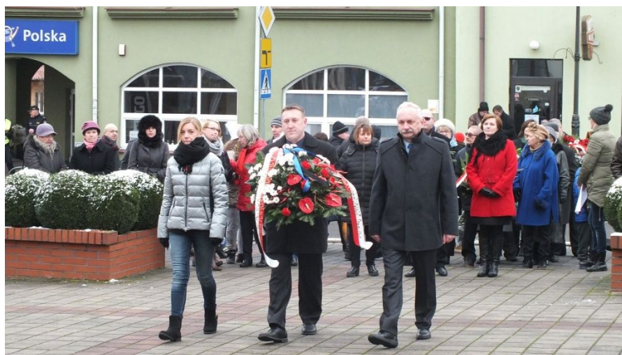
Obchody Święta Niepodległości w Serocku

Bierzemy aktywny udział w przedsięwzięciach mających na celu upamiętnienie ważnych wydarzeń zarówno w historii regionu jak i na szczeblu państwowym.