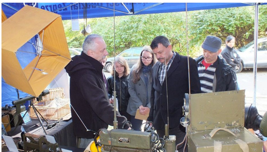
Nasza wystawa podczas XX Festiwalu Nauki w Jabłonie

Nasza działalność jest wielokierunkowa i zgodna z celami statutowymi Związku. Jednym z głównych zadań jest kultywowanie historii i tradycji łączności wojskowej. Realizujemy to na wiele sposobów. Regularnie organizujemy wystawy historycznego sprzętu łączności. Wykorzystujemy do tego celu między innymi imprezy na szczeblu lokalnym, w których bierzemy udział. Regularnie prezentujemy sprzęt łączności podczas Festiwalu Nauki w Pałacu w Jabłonie.