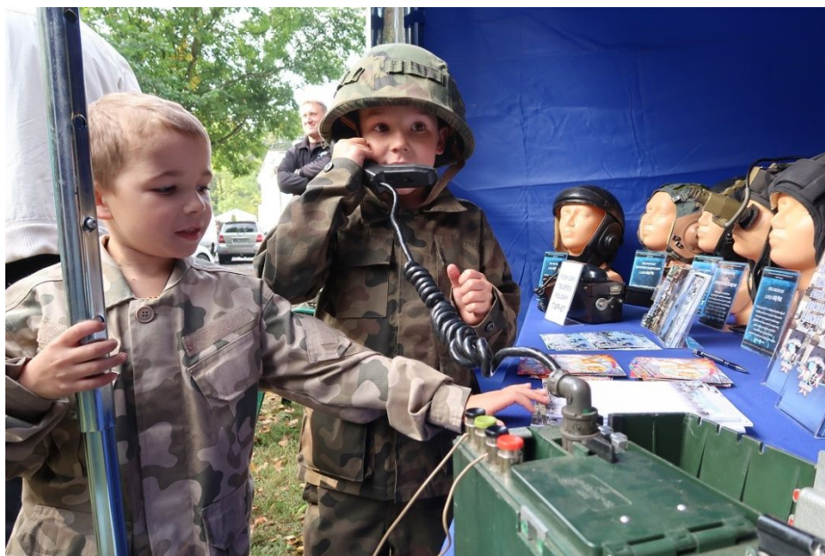
Młodzi „łącznościowcy” podczas jednej z imprez plenerowych

Propagowanie tradycji łącznościowych to nie tylko wystawy. Podczas innych imprez w środowisku lokalnym staramy się promować nasze tradycje na ile pozwalają okoliczności i skromne wyposażenie, które jest jednak wystarczające by zaszczepić nić zainteresowania nawet w najmłodszym pokoleniu.