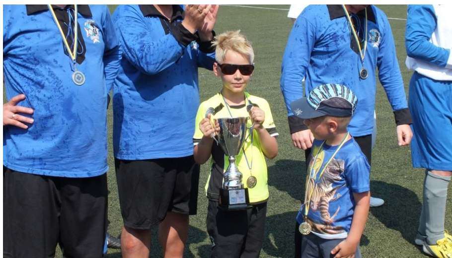
Nasz puchar z zwycięstwo w I turnieju retro piłki nożnej w Łowiczu

turniejach piłki nożnej. W pierwszym - historycznym turnieju zdobyliśmy puchar za I miejsce. Nasza reprezentacja wystąpiła w strojach uszytych przez naszą Koleżankę wg. regulaminów pochodzących z okresu II Rzeczypospolitej. Oczywiście stroje były w barwach łącznościowców wojskowych czyli chabrowo-czarnych. Piłka którą graliśmy została również uszyta wg. przepisów pochodzących z tamtego okresu. W trakcie turnieju pokonaliśmy m.in. reprezentację 10 Brygady Logistycznej z Opola.