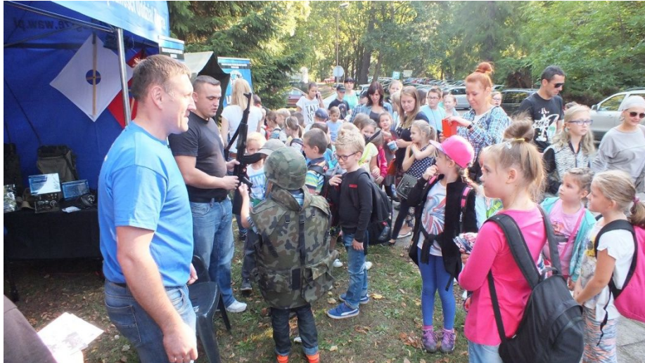
Dla takich chwil - warto ...