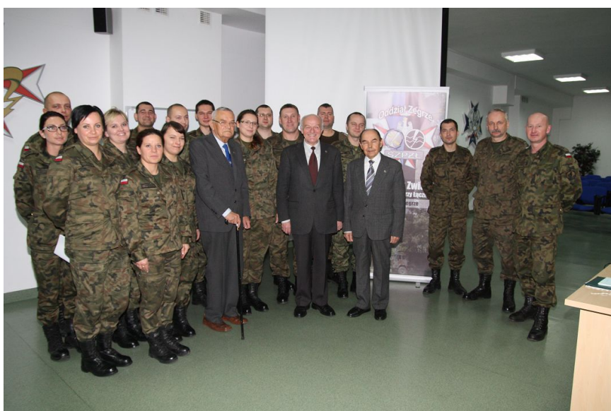
Uczestnicy zebrania założycielskiego (większość)

6 grudnia Zarząd Główny SZPŻŁ podjął uchwałę o powołaniu Oddziału Zegrze.