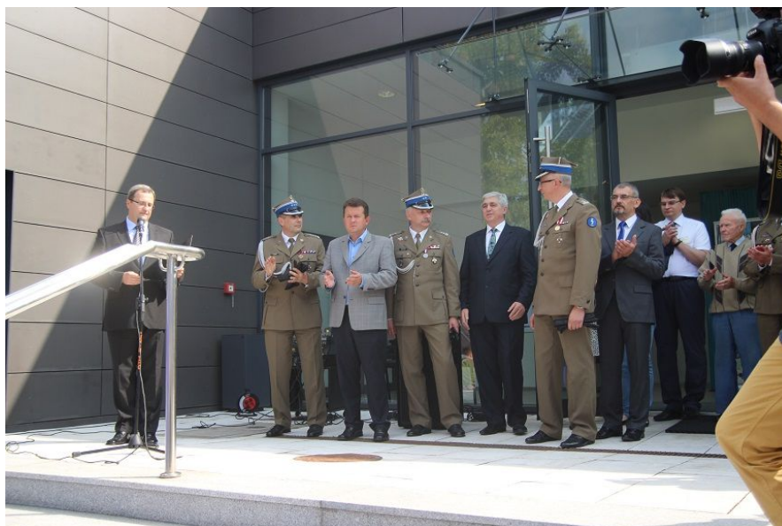
Otwarcie wystawy w Muzeum Historycznym w Legionowie