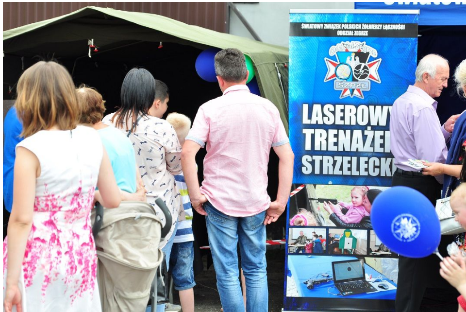
Piknik charytatywny w parafii pod wezwaniem św. Kantego w Legionowie