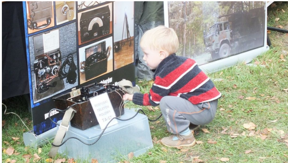
... i dla takich