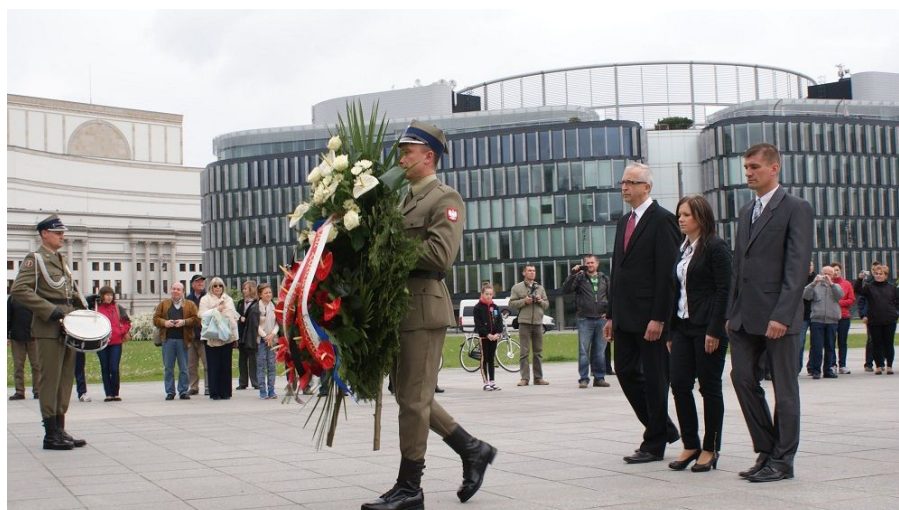
Składanie kwiatów pod Grobem Nieznanego Żołnierza z okazji rocznicy Bitwy o Monte Cassino