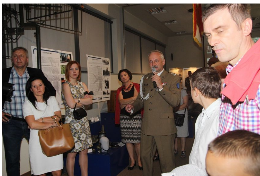
Podczas zwiedzania wystawy