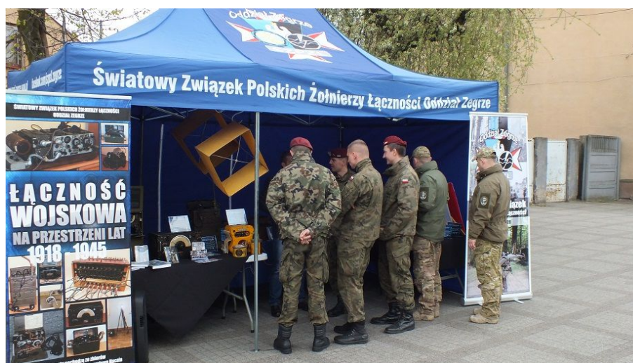
Wystawa podczas Konferencji Łączności w Sieradzu

Znamy nas również w Sieradzu, gdzie podczas Konferencji Łączności organizowanej przez 15 Sieradzką Brygadę Wsparcia Dowodzenia i oddział Sieradz ŚZPŻŁ prezentowaliśmy nasze najciekawsze eksponaty.