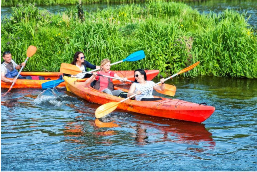
Spływ kajakowy - maj 2016

Oddział Zegrze jest jednym z najmłodszych wiekowo (uśredniając) oddziałów w Związku. Ale przekrój wiekowy jest bardzo szeroki. Są zarówno osoby w wieku dwudziestu paru jak i dziewięćdziesięciu lat. Najciekawsze jest to, że do oddziału nie należą tylko osoby z okolic Zegrza ale praktycznie z całej Polski. Są członkowie z Legnicy, Łodzi czy Jasła. Wszystkie te osoby chcą należeć do oddziału, który „stacjonuje” w kolebce łącznościowców. W chwili obecnej jesteśmy największym liczebnie oddziałem. Oczywiście to w każdym momencie może ulec zmianie, ale nam nie chodzi o liczby. Ważne jest, że zebrała się grupa ludzi którym chce się działać mimo bezinteresownej niechęci innych, których głównie drażni fakt, że inni mają zapał i chęć do działania. Działania bezinteresownego, często poświęcając swój wolny czas i bardzo często dokładając do naszej działalności własne pieniądze. Dlatego to jest piękne i rokuje dobrze na przyszłość, że są osoby, które bez względu na wszystko chcą działać na rzecz kultywowania historii i tradycji wojskowej łączności, przy okazji działając na rzecz społeczności lokalnej.