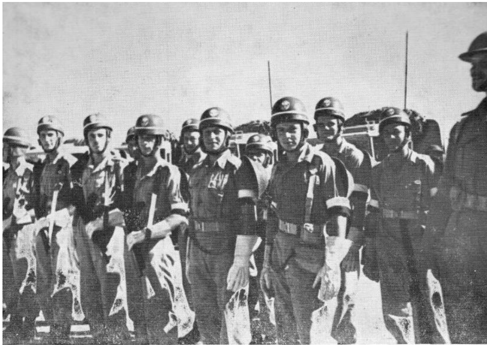
Pluton gości motorowych

Począwszy od pierwszych dni 1942 roku, zaraz po wizycie gen. W. Sikorskiego w ZSRR, Polskie Siły Zbrojne zaczęły się rozrastać. Rozpoczęto formowanie czterech nowych dywizji. Jednocześnie zapadła decyzja przeniesienia całości wojsko polskiego do Azji Środkowej. Powiększanie się PSZ pociągnęło za sobą konieczność sformowania odpowiedniego dla potrzeb dowództwa oddziału łączności. Miał być nim pułk łączności.