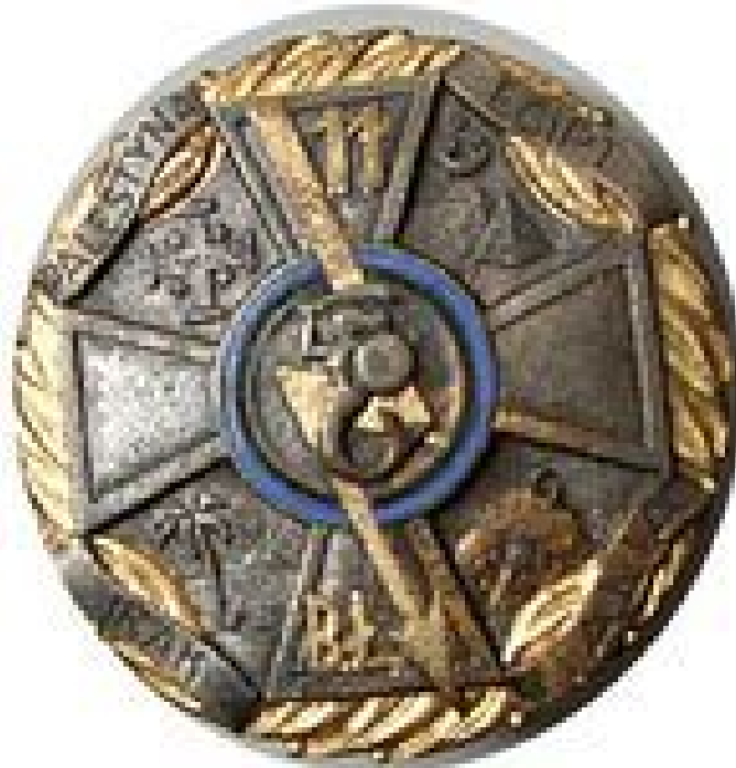
Odnaka pamiątkowa 11 batalionu łączności

Pisząc artykuł opierałem się głównie na książce „11 batalion łączności” wydanej przez Koło byłych żołnierzy 11 batalionu łączności w Londynie. Książka dostępna jest m.in. w zbiorach archiwum Światowego Związku Polskich Żołnierzy Łączności, znajdującego się obecnie w bibliotece Centrum Szkolenia Łączności i Informatyki w Zegrzu.