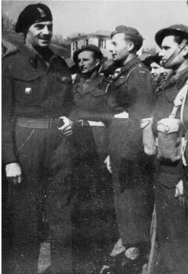
Przeгляд batalionu przez dowódcę Korpusu

20 lipca dowódca Armii Polskiej na Wschodzie rozkazem 109/Tj/SS/SD/43 zmienił nazwę batalionu na 11 batalion łączności Korpusu (11 Polish Corps Signals), ustalając jego stan według angielskiego etatu W.E.808/1 Nr. 700653. Rozkaz ten nadał również nowe nazwy i nową formę niektórym pododdziałom batalionu. Z 3 kompanii łączności artylerii, która została rozwiązana wyodrębniony został pluton łączności dowódcy grupy artylerii korpusu i pluton łączności dowódcy artylerii korpusu. Pluton radiotelegraficzny specjalny „B” przemianowany został na 11 pluton radiotelegraficzny specjalny a pluton informacyjny „C” na 12. pluton informacyjny specjalny.