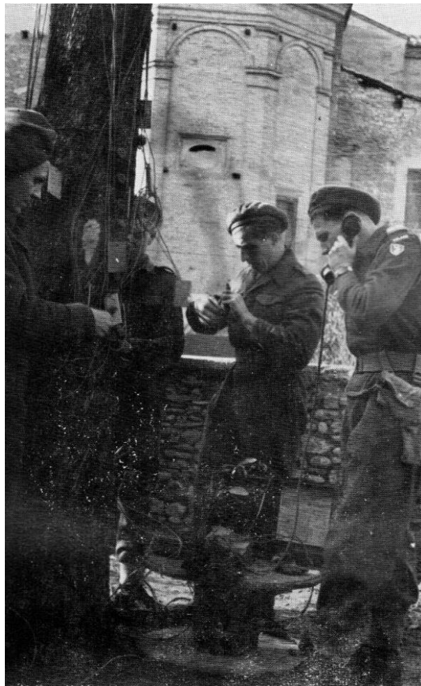
Nad rzeką Sangro - sprawdzanie linii

Marzec 1946 roku to wydarzenie ważne i trudne do zapomnienia. Rozdawane są żołnierzom dwie proklamacje. Jedna od tzw. rządu warszawskiego a druga od ówczesnego ministra spraw zagranicznych Wielkiej Brytanii. Minister Wielkiej Brytanii na równi z tzw. rządem warszawskim namawiał żołnierzy 2 Korpusu Polskiego do powrotu do Polski. Ogólne oburzenie wywołał fakt, że obie odezwy rozdawane były pod nadzorem oficerów brytyjskich. W ostateczności nikt nie zapisał się na powrót do Polski.